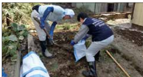
豪雨災害被災者支援(長野での活動の様子)