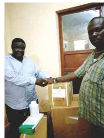
医薬品支援(シエラレオネ)