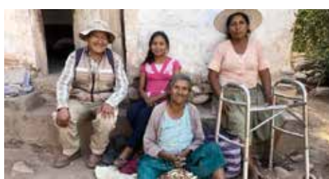
サポートチャイルドと家族(ボリビア)