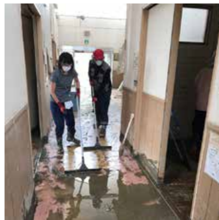
西日本豪雨災害被災者支援 (岡山真備町)