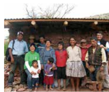
里子の家の修理 (ボリビア)

※数字の単位は全て円です。※駐在スタッフの支援金には、年金・海外旅行傷害保険などが含まれています。