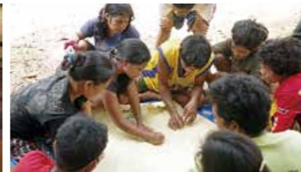
ハンズ・オブ・ラブ・フィリピンの住民参加型の村調査 (ミンドロ島ナウハン県シド村)