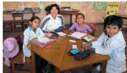
子どもの教育支援と地域開発支援 (ボリビア・リオカイネとアサウニ)